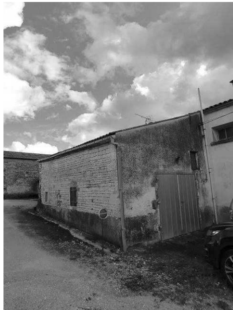
Vue Nord Ouest

Sur le côté Sud-Ouest, la propriété est fermée par un mur en pierres, ancien, couvert de tuiles.