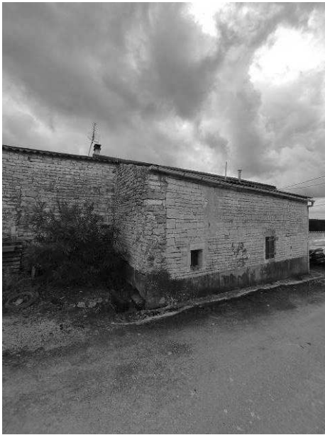
Vue Nord Est